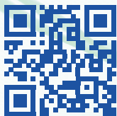
Imagem: Ad Médic

Consulte a versão online do Programa com Resumos